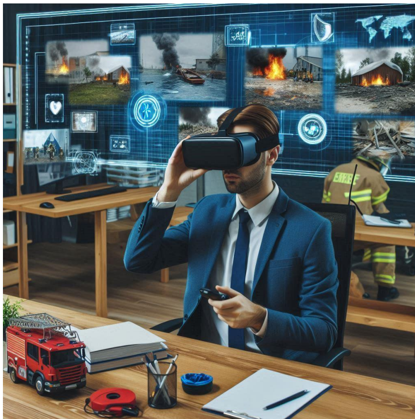
Imagen creada con Inteligencia Artificial

3.- ¿Qué métodos de enseñanza y herramientas didácticas se están utilizando para promover una comprensión integral de la Gestión de Riesgos y la Protección Civil entre los estudiantes?