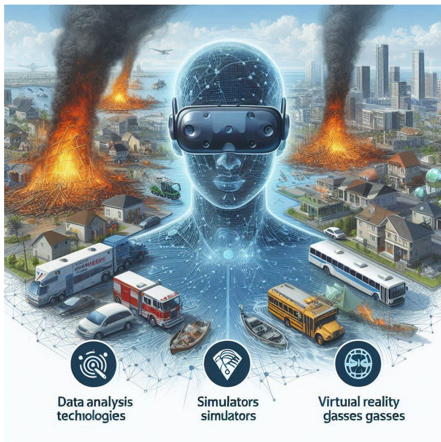
Imagen creada con Inteligencia Artificial

2.- ¿Cómo se han adaptado los programas académicos de las universidades para abordar los desafíos actuales y emergentes en materia de riesgos y desastres?