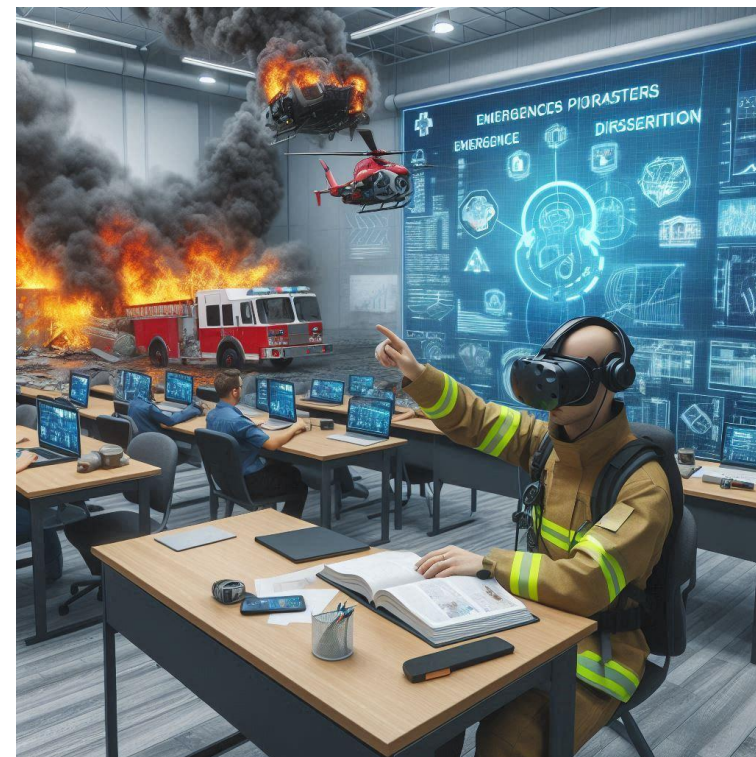
Imagen creada con Inteligencia Artificial